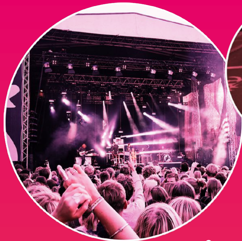
Stor sing-a-long i Kungsträdgården 6 april kl 16