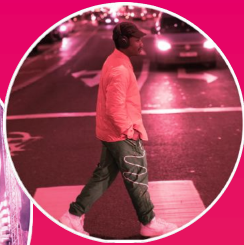
Övergångsställen runt Kungsträdgården spelar Waterloo