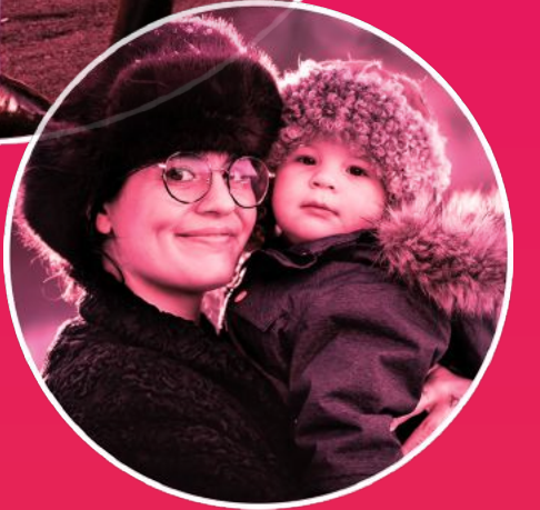
ABBA the Museum firar med uppdaterad utställning om Waterloo, karaoke, quiz och "Waterloo-jakt"